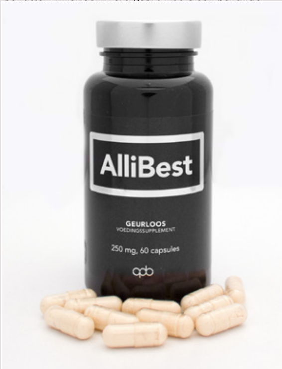
Voorbeeld van een hooggeconcentreerd knoflooksupplement.

werd diëtetiek onderwezen om knoflook optimaal te benutten. Knoflook werd gebruikt als een behande-